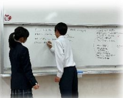
学校経営戦略会議(和会議)