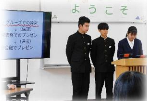
PTA 総会でのプレゼン